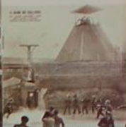
1947, manifestation de solidarité avec les mineurs de Belgique