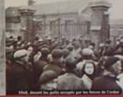
1947, devant les puits creusés par les mines de Lorraine