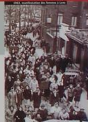
1963, manifestation des femmes à Lure

1963 Grève générale et sentrale sur le plan national, chez les mineurs de fond. La solidarité se manifeste, marche, dans la population, chez les cheminots, les postiers, les dockers... A court terme, la grève est un succès : revalorisation du métier et hausses de salaires. Mais la liquidation des Charbonnages aura-t-elle lieu ?