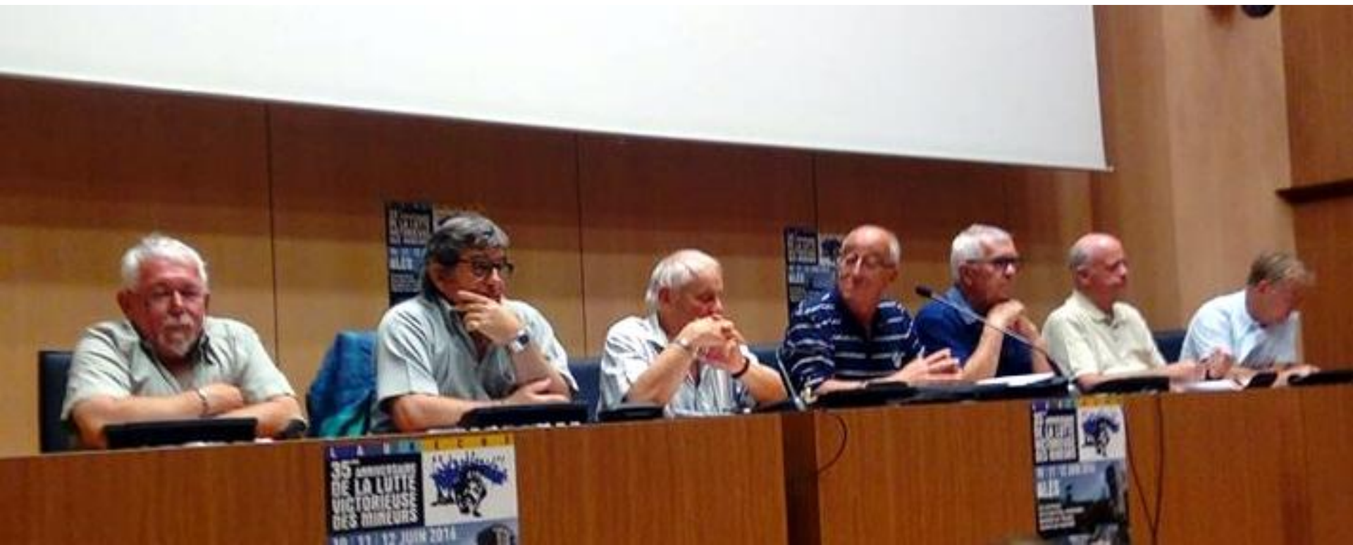
Les intervenants à la tribune du colloque le vendredi 10 juin