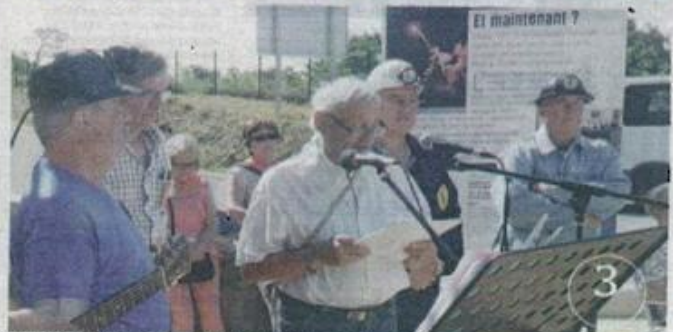
1- Les 8 panneaux de l'exposition permanente sont enfin posés devant le frêne au pied du Cheval de Ladrecht. Memento de cette grève de trois mois menée par les mineurs des Cévennes. 2- Les célébrations du 35ème anniversaire du COEIR de Ladrecht ont débuté vendredi soir par un débat public sur l'histoire des luttes sociales et l'importance d'un faire vivre la mémoire. 3- Hier matin émotion mais aussi détermination devant l'exposition installée face à la rocade de Destivert bientôt renommée ainsi par les élus de St Martin de Valgugnes.