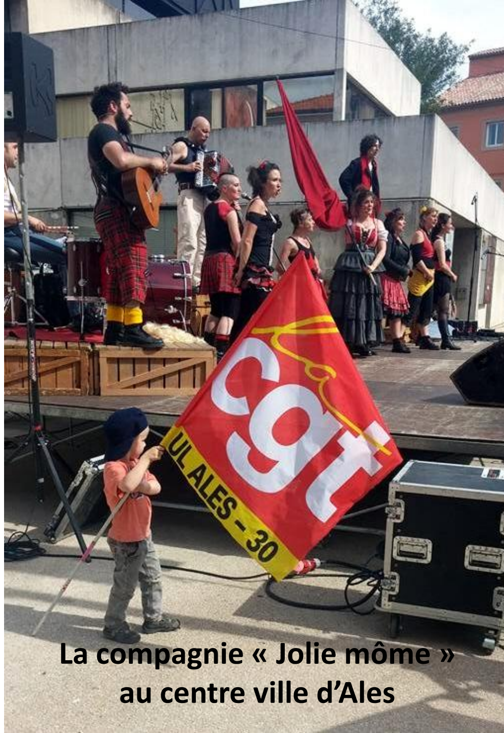
La compagnie « Jolie môme » au centre ville d'Ales