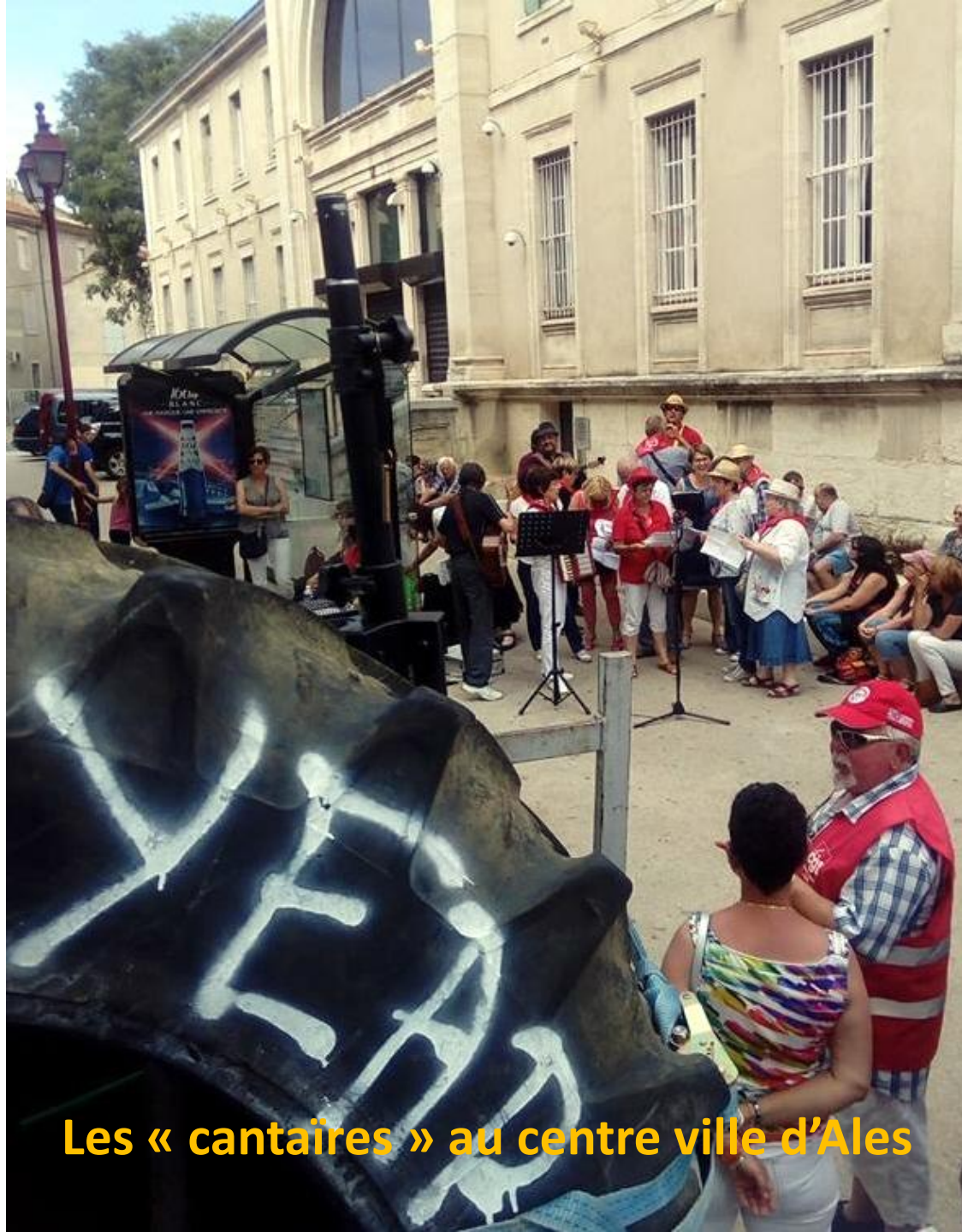
Les « cantaires » au centre ville d'Ales